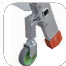
Ruote anteriori Ø 80 mm piroettanti, autofrenanti su porta ruote in alluminio fuso

81/2008 DECRETO LEGISLATIVO Barra stabilizzatrice con i supporti delle ruote in alluminio fuso