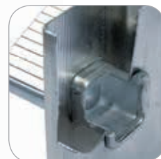
Energico doppio bloccaggio idraulico senza rivetti