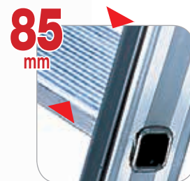
Gradini profondi 85 mm